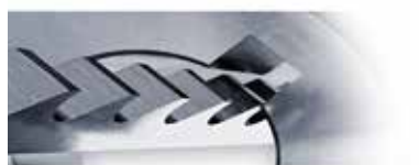
ブローチ加工およびスロッター加工