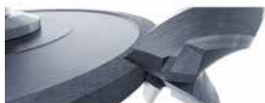
研削およびホーニング加工

お客様に一番ふさわしい製品をご提案するためには、お客様の加工の内容、それに金属加工油に何を求められるかを詳しく教えていただくことが大切な要素となります。当社の専門家たちが喜んでアドバイスさせていただきますので、お気軽にお問い合わせください。