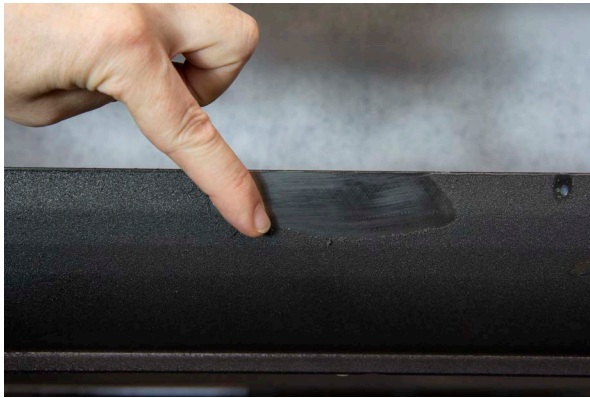
机床和工件易于清洗