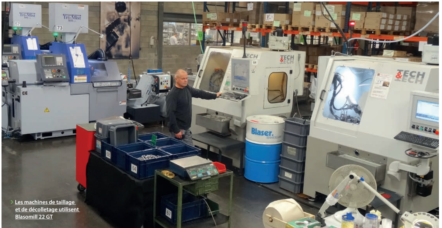
➤ Les machines de taillage et de décolletage utilisent Blasomill 22 GT

l'outil HSS par du carbure revêtu », s'enthousiasme Christophe Simon. Dans cette configuration, l'atelier peut produire 1,2 million de poires en séries dans différentes tailles avec deux machines au lieu de trois équipements d'ancienne génération. Le temps de cycle est de 13 secondes par pièce, soit un gain de 10%. La fraise mère en HSS revêtue en TIN était changée au bout de 3 000 pièces. Aujourd'hui, grâce au lubrifiant la solution outil carbure autorise la production de 60 000 à 90 000 poires. Le changement d'outil est planifié une fois tous les quinze jours afin de garantir une qualité constante sans opération d'ébavurage.