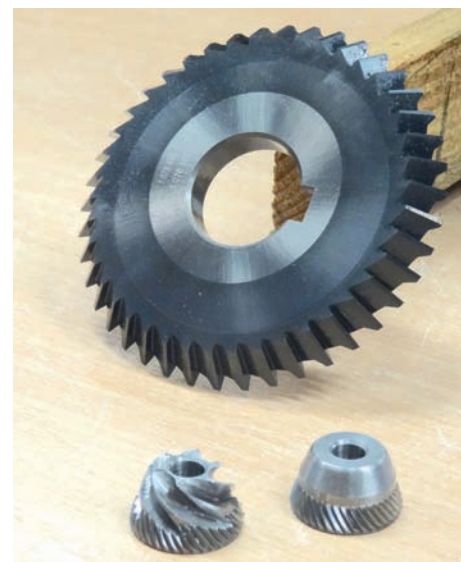
► La poire, du brut à la pièce usinée

Dans ce processus, les pièces sont acheminées de façon automatique par un bol vibrant, taillées puis éjectées : tout est automatisé ! « Outre le lubrifiant réfrigérant utilisé, nous avons réussi à faire le changement de