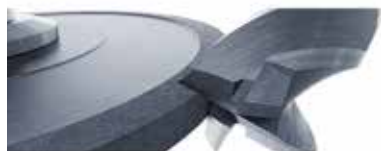
Rectification et rodage

Afin de vous recommander le produit le mieux adapté à votre application, nous devons connaître votre processus de fabrication et vos exigences en matière de lubrifiant réfrigérant. Mettez-vous en relation avec nous. Nos professionnels vous conseilleront volontier.