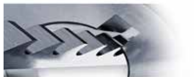
Brochage et mortaisage