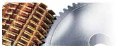
Taillage par génération